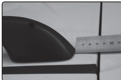
Zadní patku umístěte 30 mm od zadní hrany střechy.