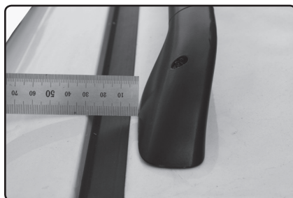
Přední patku umístěte 5 mm od vnitřní hrany střešní lišty vozu.