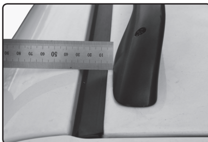
Zadní patku umístěte 5 mm od vnitřní hrany střešní lišty vozu.