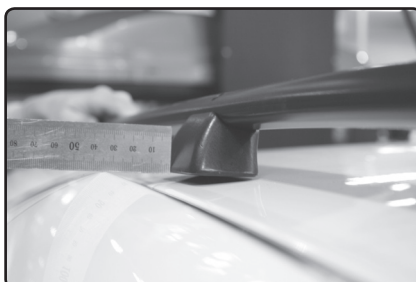
Střední patku umístěte 10mm od vnitřní hrany podélné střešní lišty vozu.