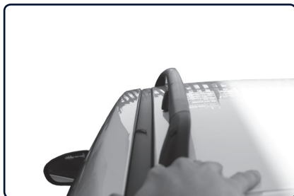
Podélný střešní nosič se instaluje na vnitřní stranu od podélné střešní lišty vozu.

Určete přední a zadní patku nosiče (uvnitř patky písmeno „P“ označuje přední patku). Pokud je vůz vybaven střešním oknem dbejte na to, aby jste střešním podélným nosičem neomezili funkci střešního okna.