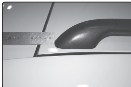
Zadní patku umístěte 30mm od zadní hrany střechy.