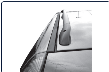
Podélný střešní nosič se instaluje na vnitřní stranu od podélné střešní lišty vozu.

Určete přední a zadní patku nosiče (uvnitř patky písmeno „P“ označuje přední patku). Pokud je vůz vybaven střešním oknem dbejte na to, aby jste střešním podélným nosičem neomezili funkci střešního okna.