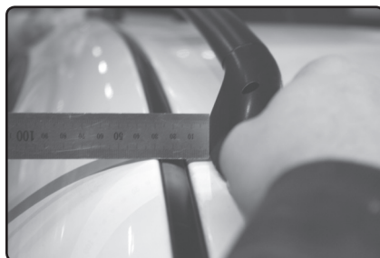
Přední patku umístěte 10mm od vnitřní hrany podélné střešní lišty vozu.