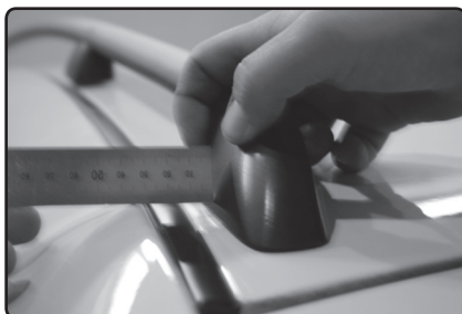
Zadní patku umístěte 10mm od vnitřní hrany podélné střešní lišty vozu.